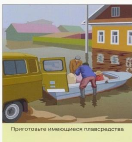
Приготовьте имеющиеся плавсредства