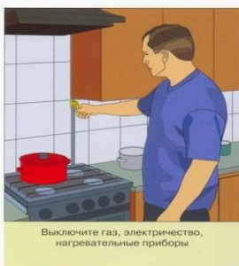
Выключите газ, электричество, нагревательные приборы