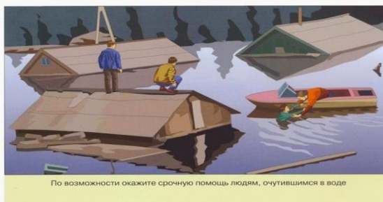
По возможности окажите срочную помощь людям, очутившимся в воде