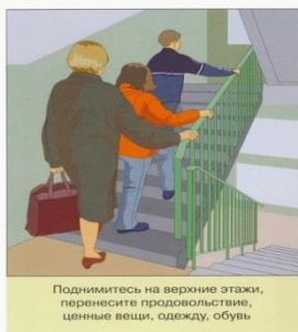
Поднимитесь на верхние этажи, перенесите продовольствие, ценные вещи, одежду, обувь