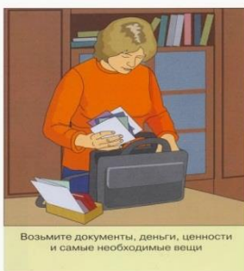
Возьмите документы, деньги, ценности и самые необходимые вещи