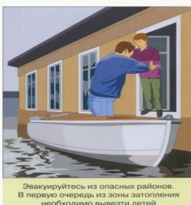
Эвакуируйтесь из опасных районов. В первую очередь из зоны затопления необходимо вывезти детей