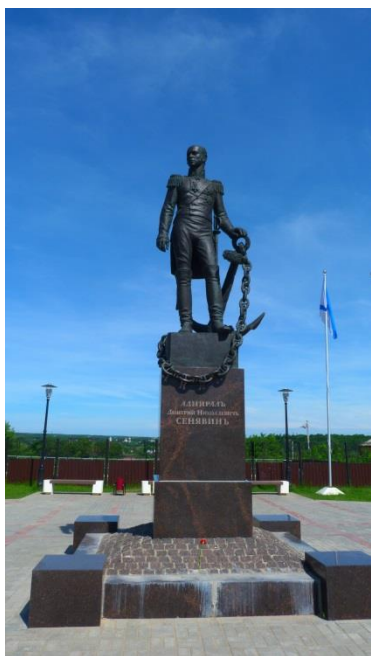
Памятник адмиралу Д.Н.Сенявину

По вопросам организации туристских туров и экскурсионных программ обращайтесь по тел.: 8(965) 706-04-04 и 8(980) 712-48-37 эл.почта: sseleznewa@yandex.ru