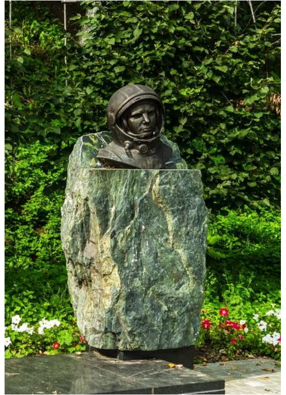
Памятник космонавту Ю.А. Гагарину