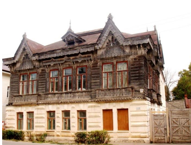
Городская усадьба Шокиных, конец XIX века