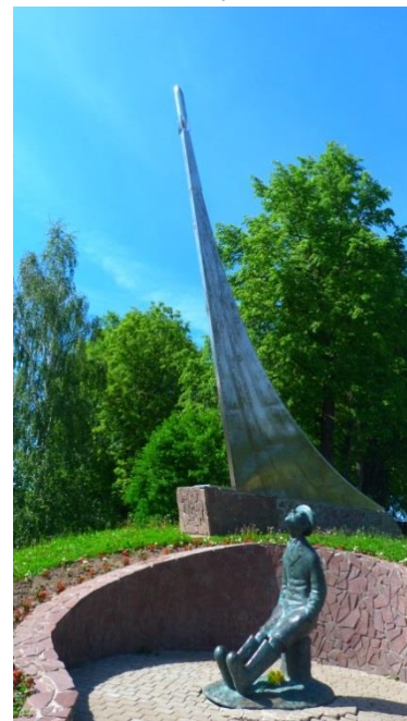
Памятник философу, изобретателю К.Э.Циолковскому