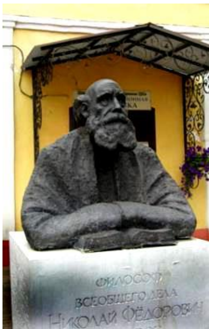
Памятник философу Н.Ф. Федорову